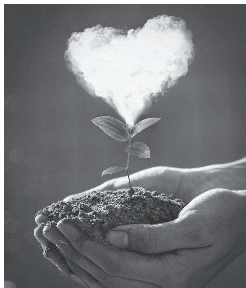
Рис. 2. https://www.instagram.com/p/Bdo2huWDHHe/

Трудно найти поэта или писателя, который бы не обращался в своем творчестве к образу сердца. В компьютерной графике и на страницах социальных сетей сегодня это самый популярный и притягательный для многих символ (рис. 2 и 3). Однако сердце – это не просто орган чувств, как принято считать в обыденности, о чем свидетельствует активная эксплуатация этого значения – кнопка «like» в соцсетях как знак одобрения, причем без четкой грани между «любить» и «нравиться». Б.П. Вышеславцев утверждает, что сердце – это отнюдь не простая поэтическая метафора, а математически точное явление, описанное на религиозном или художественном языке.