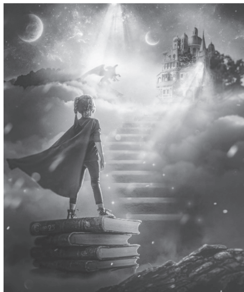
Рис. 1.

И в религиях, и в литературной традиции, и в разных культурах отмечена связь слова с душой и сердцем. Например, в ряде арабских пословиц: